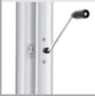
Innenl. mit Kurbel